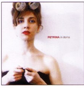
PETRINA in doma